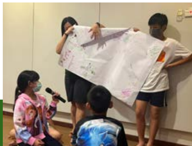
初少团契分组分享讨论

圣殿是指教会建筑与设施，例如冷气机可以改为水源或冰块的节能冷气机；穿着凉爽的服装，调