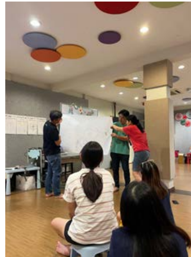
家长组呈现：如何呵护家？