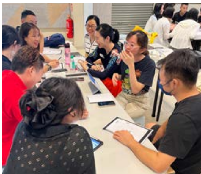
分组互动，练习会话

因为这些问题，团队曾多次商讨，改革。希望变换教学模式将事工做得完善。然而问题并没有得到改善。英语班的出席人数每况愈下，服事团队士气大受打击。那段时期，我们在困境中寻找出路，尝试采用角色扮演，尝试过看电影学英文，更有老师主动利用自己的时间做线上教学。即便上课的人数不多，几位学生也是我们服事的对象。人数少也有其优势，我们之间可以建立更好关系。