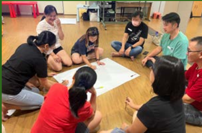
父母组讨论：如何呵护家？

整冷气温度或多开窗口；提升通风或排气系统，减少热量；安装 LED 灯泡；使用太阳能等。