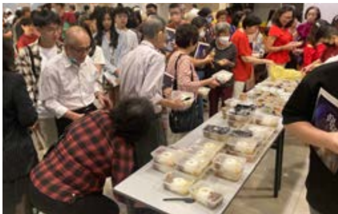
乐龄主日当天为会众预备丰富茶点