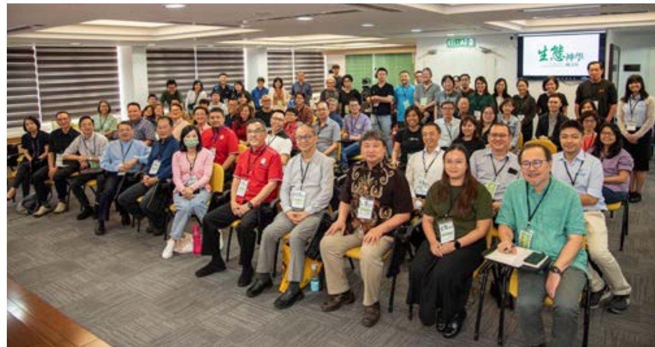
2023年9月27-28日 MCRD 生态神学研讨会

这星期你抬头看过天空吗？ 这星期你看过云朵了吗？ 这星期你看过月亮星星了吗？ 这星期你感受了太阳的温暖吗？ 这星期你感受了与雨水接触了吗？ 与大自然为友，需要些许互动哦！