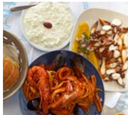
纳克索斯岛是个吃海鲜的好地方。