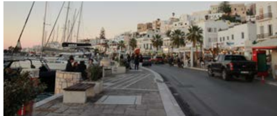
即使是在最主要的城镇，游客数量也不算太多

或许有那么一天，在这个希腊的小岛上，会出现一个伟大的艺术家。因为在2022年的那个秋天，他答应自己，要一直画下去。✿