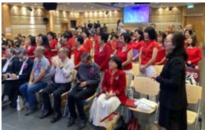
主席宣布乐龄诗班成立

求圣灵常常来挑旺诗班员的心，忠心事奉，热心爱人，活出常常喜乐、不住祷告，凡事谢恩，牢记这是基督向我们所定的旨意。🙏