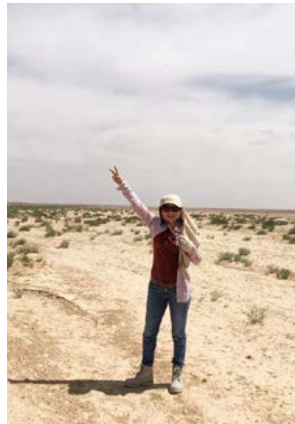
旷野中常有野狼出现

没错，约旦这沙漠国家有许多狼。不只有本土的阿拉伯狼，还有来自世界各国其他的品种。各有各的习性手段和目的，共同点是凶猛！进入狼群中，练就如蛇般的灵巧，才得以生存，完成任务且全身而退。