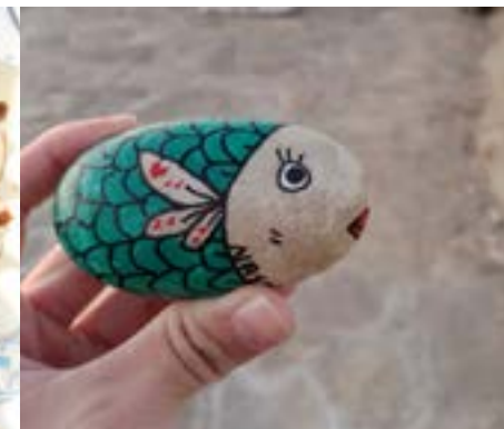
画了一条鱼的彩绘石头和正在收摊的少年。