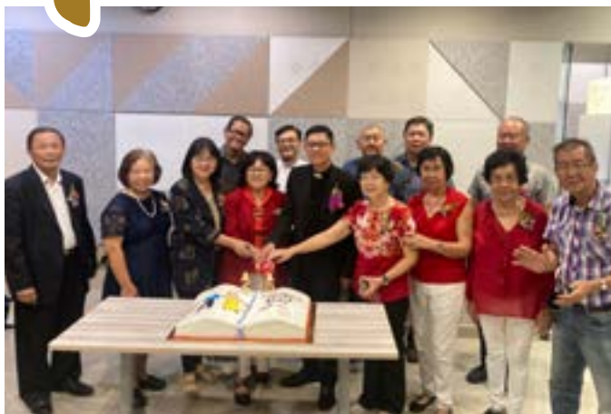
庆祝乐龄团契成立25周年

不是每一道江流都能入海，不流动的便成了死水；不是每一粒种子都能成树，不生长的便成了空壳！不是每一个人能成为基督徒，一个基督徒的生命也是如此，如果神不拣选，就不能够实现生命的更新。