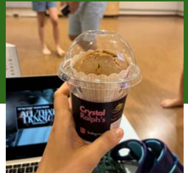
初少派对：孩子回应环保的重要，把杯子蛋糕包装在用过的塑料杯当中

这类似的操练需要持续性，至少5-7年，养成习惯和成为教会文化。我们一起为我们的“家”加油哦，预备好迎接基督的再来！