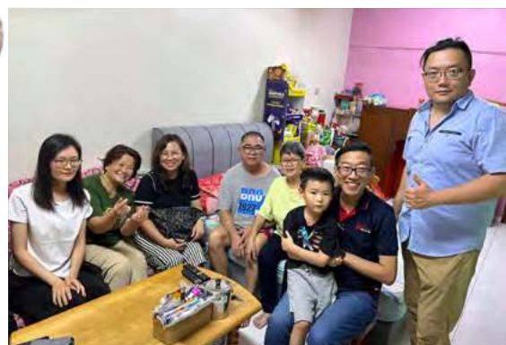
开幕礼结束后，旅马华侨兄弟姐妹到新村的住家探访。