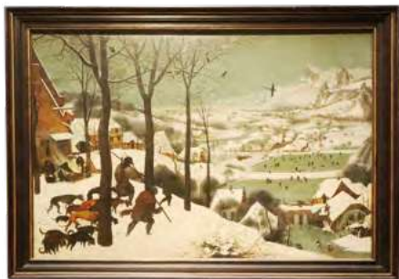
雪中猎人（The Hunters in the Snow/The Return of the Hunters），文艺复兴时期老彼得·勃鲁盖尔（Pieter Bruegel the Elder）的16世纪油画作品。