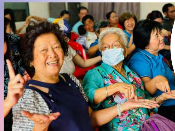
破冰游戏，大家开心笑哈哈。