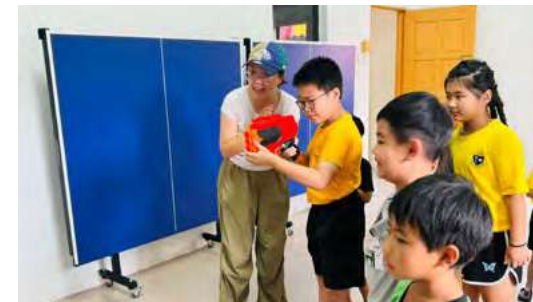
游戏站2：射枪瞄准目标。