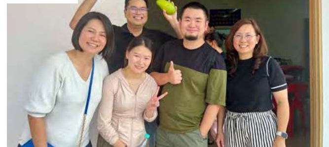
美佳堂的弟兄姐妹一起来参与开幕礼服侍。

孩子们，我决定要参与服事。尽管我一无所长，但我能扫地，每次活动结束后负责清扫，好让他们尽早返回吉隆坡。