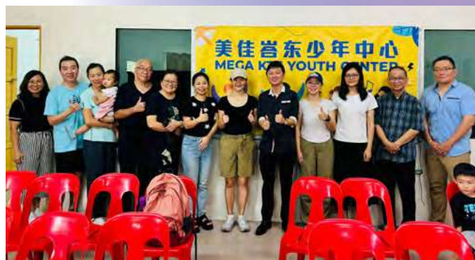
美佳堂的牧者执事和参与开幕礼服侍的旅马华侨兄弟姐妹。