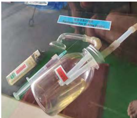
用于吸食冰毒的过滤器。