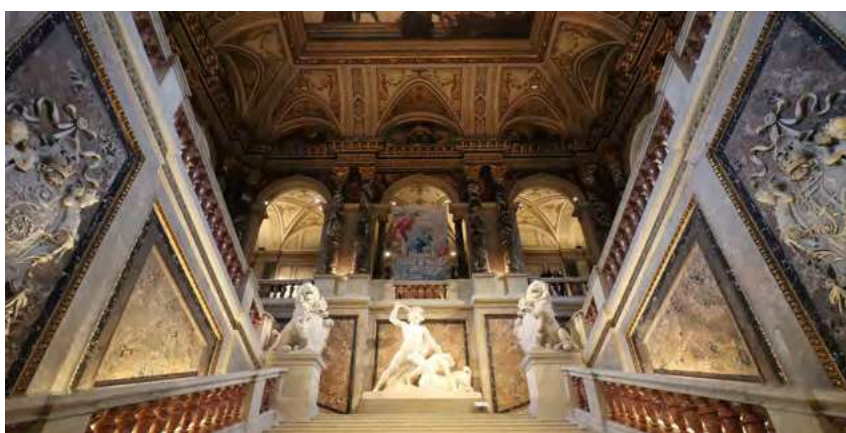
艺术史博物馆（Kunsthistorisches Museum Wien）入口雕刻精细的大理石像——英勇的 Theseus 正在与喝酒闹事的人马兽搏斗。

抵达维也纳的酒店时已是傍晚时分，但为了把握明天就开始闭门休息的阳光，我还是立马往外狂奔。先是到富丽堂皇的美泉宫（Schloss Schönbrunn）走走，然后又回到市中心漫步，一直到我的小腿抗议了才肯罢休。