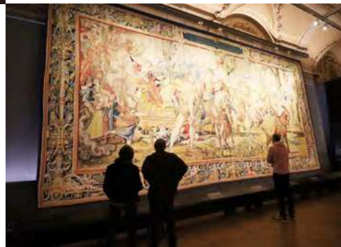
细腻程度令人叹为观止的壁画挂毯。

选择在十二月尾开始这场欧洲之旅，其中一个最大的梦想就是希望可以经历人生中的第一场