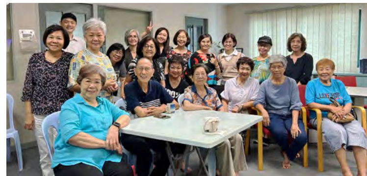
长辈们踊跃参加日间活动。

在活动中，这群乐龄长辈总是怀着好奇和求知的心态学习。当他们掌握了某项APP的操作，脸上洋溢着满足和喜悦。其中有一些长辈对自身的学习要求很高，经常感叹：“上一个APP还没完全学会，就要学习新的了！”他们认真的学习态度让我敬佩，也让我体会到他们对知识的渴望和与时代接轨的决心。