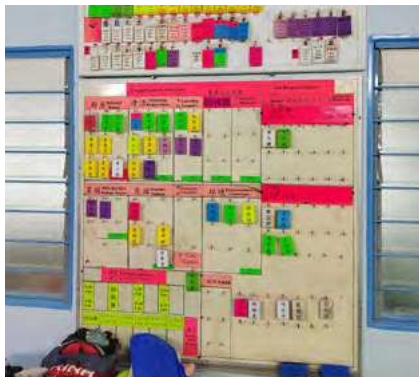
学员依照状况分组。