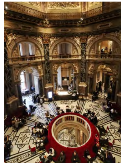
艺术史博物馆里古典气派的咖啡厅。