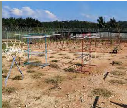
学员学习种植的地方。