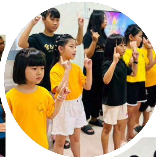
峇东新村主日学孩子献唱诗歌。