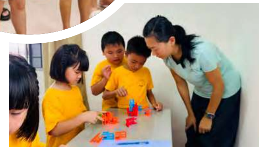
游戏站1：把小椅子叠高高。