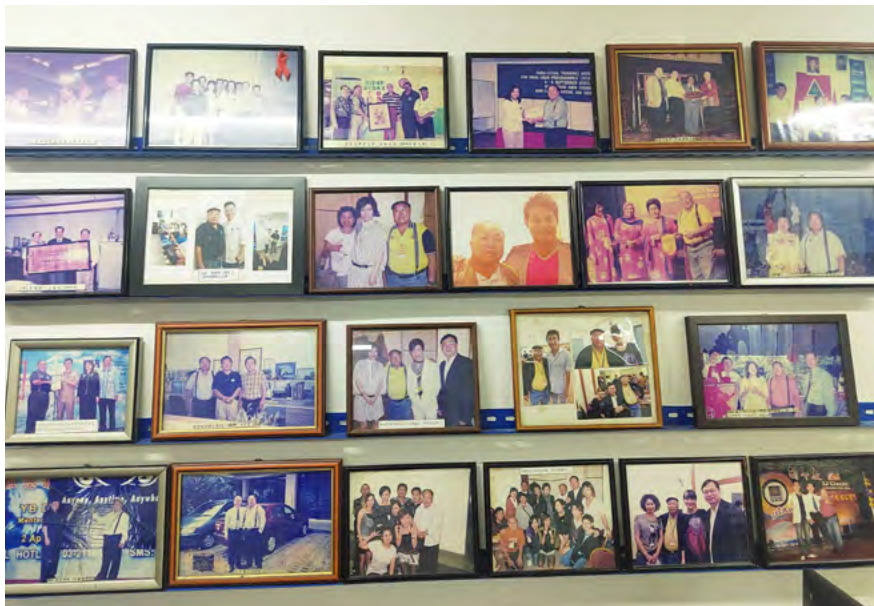
不少来自海外的艺人也曾探访得胜之家。